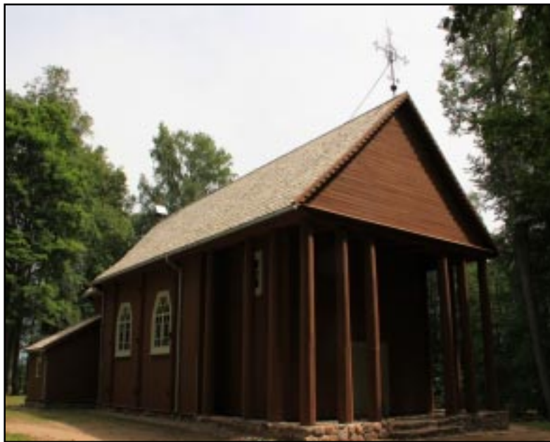
Renovuota Stelmužės bažnyčia.

Tačiau šiandienos realybė yra žymiai sudėtingesnė, negu gražios ir išpūdingos legendos. Ažuolas sunkiai serga. Gydė jį, remontavo. Tiesa, prieš keletą metų senolis nukentėjo nuo vangiščių. Jie nuplėšė vario