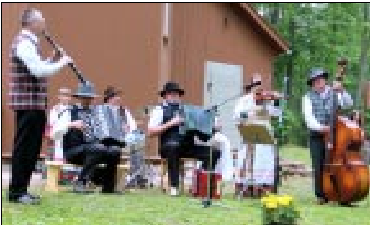
Groja Suvieko kaimo kapela „Cinkelis“.