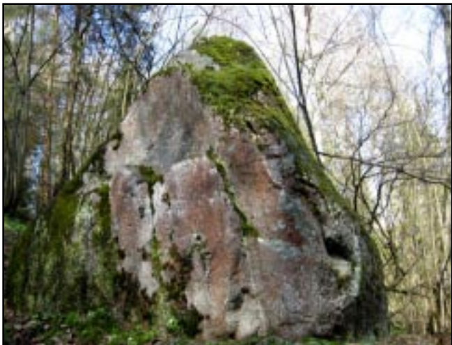
Mokas – garsiausias Tauragnų krašto akmuo.