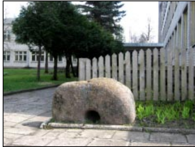
O prie Tauragnų mokyklos senajam tikėjimui tarnavęs akmuo laikomas dėl gražumo.

Labiau pastebimi tarp šventųjų akmenų minimi dubenuotieji akmenys - pagoniškosios baltų religijos liudininkai. Jų randama visoje Lietuvoje. Šiais laikais žmonės juos va-