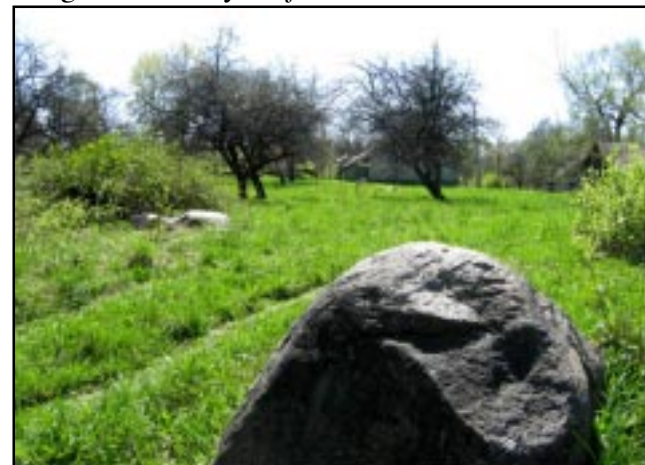
Indubakių geologinio draustinio rieduliai be šeiminių pastangų papuošę sodybą.

Galima pabandyti pasitelkti fantaziją ir pasistengti bent menkai įsivaizduoti tų gamtos kataklizmų galybę, sugebėjusią iš Skandinavijos uolynų atgabenti ir palikti Lietuvos laukuose aibę mažesnių ir didžiulių riedu-