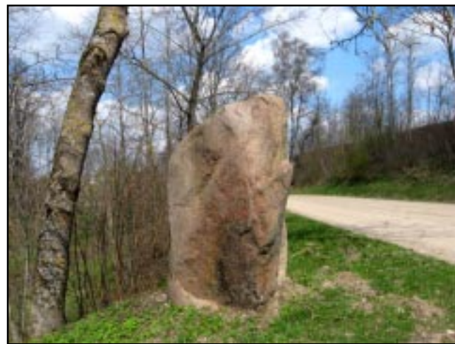
Nors ne paminklinis, bet išpūdingas.

priklausančioje teritorijoje, - akmenų taip pat apstu. Čia išsipildė mokslininko Česlovo Kudabos mintis apie akmenų draustinio reikalingumą: 1971 m. paskelbti geologiniais draustiniais Indubakių ir kiek vakariau esantis