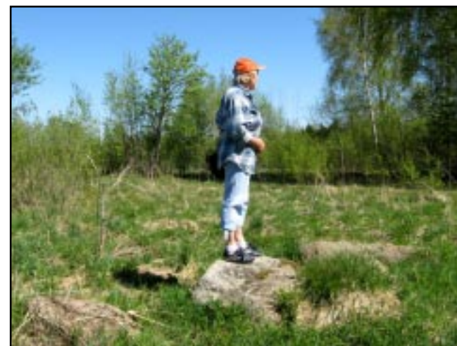
Nedaug smalsuolių užklysta į mažai kam žinomą Indubakių riedulyną.

aukštis 2,8 m, ilgis 3,66 m, plotis 3,3 m, horizontali apimtis 9,64 m. (Kituose šaltiniuose pateikti parametrai šiek tiek skiriasi – matyt, tiksliai išmatuoti netaisyklingos formos akmenį sunku). Ir tai, kaip tvirtina vietiniai žmonės, virš žemės esą matyti jo tik trečdalis. Kaip ten yra iš tikrųjų,