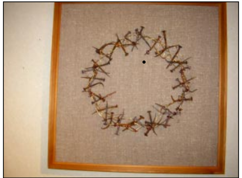
Paveikslas iš sudegusios Labanoro bažnyčios vinių ir vielų.

Šie paveikslai buvo eksponuojami Molėtų krašto muziejaus parodų salėje greita kitų rajono menininkų darbų.