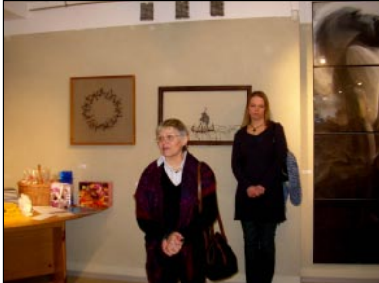
Paveikslų autorė Teresė Blažiūnienė.

Galbūt tai pirmieji iš sudegusios bažnyčios atliekų padaryti paveikslai šalyje?