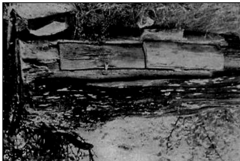
Kelminis bičių avilys.

Apie šias ir kitas problemas Dubingiuose vykusioje konferencijoje plačiai kalbėjo Taikos vėliavos ko-