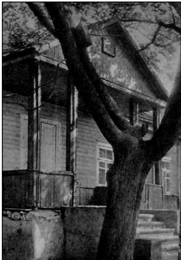
Senoji Dubingių mokykla.

bingėnams tai labai svarbu, nes šio krašto žmonės daug kraujo pralėjo dėl įvairių priešų puolimo. Antrojo pasaulinio karo metu lenkų Armija krajo išžudė per 300 nekaltų šio krašto gyventojų. Šaudė mažus vaikus, senokus, nėščias moteris!..