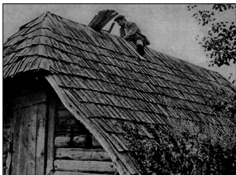
Medinė stogo danga.