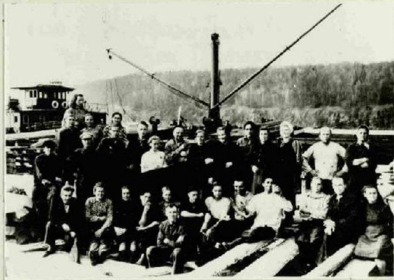
Poilsio valandėlė, baržon spa- lius kraunant. 1950 m.